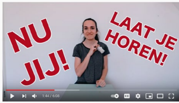
Maak je eigen Kazoo!