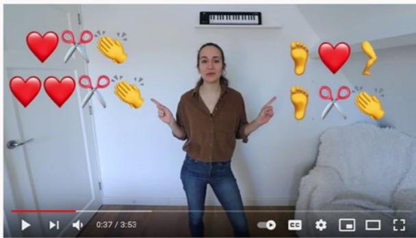
Bodypercussie met EMOJI'S!