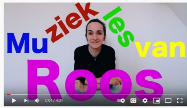
Maak je eigen instrumentje!