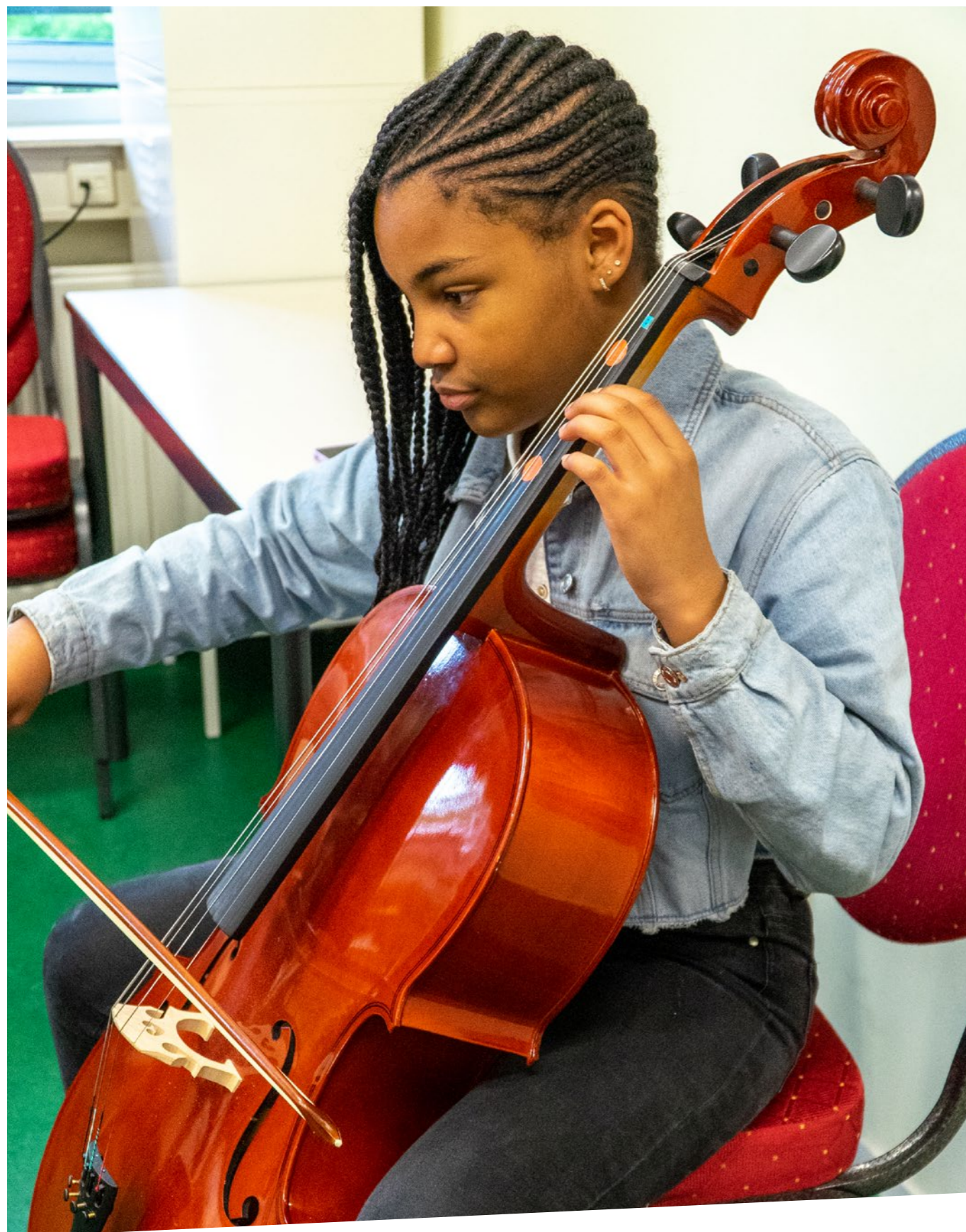
Ontwerp: Emdigio