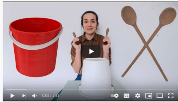
Drummen op een emmer!