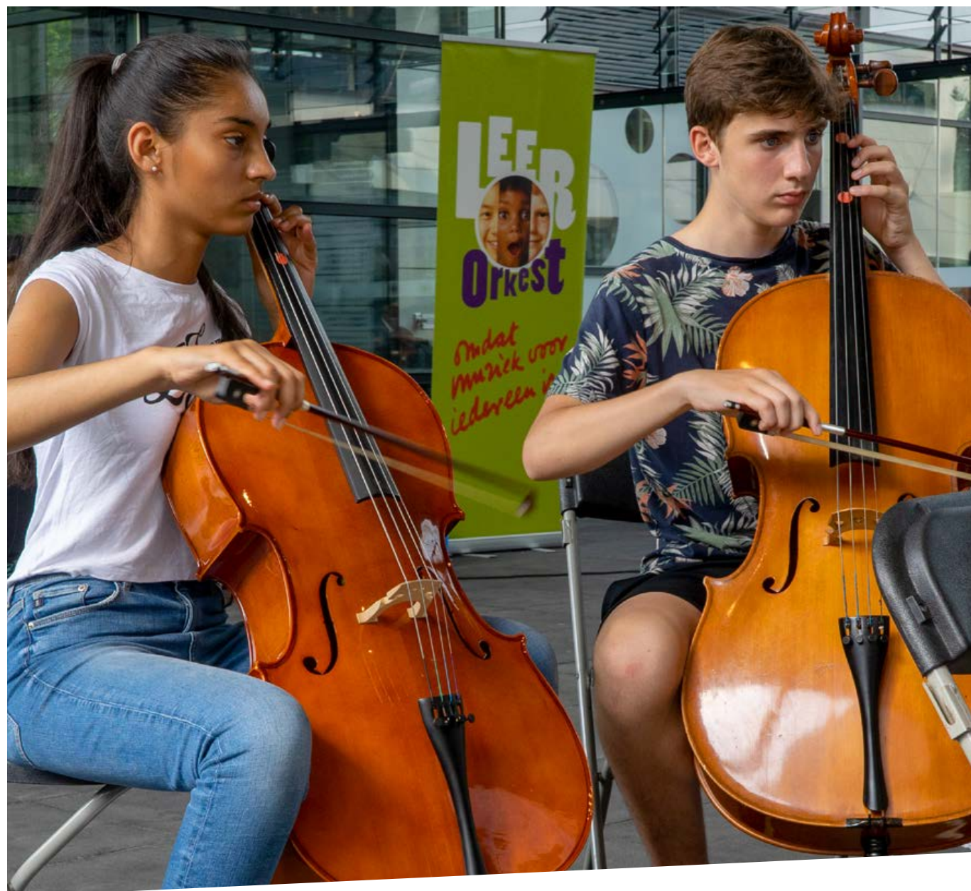
Ontwerp: Emdigio